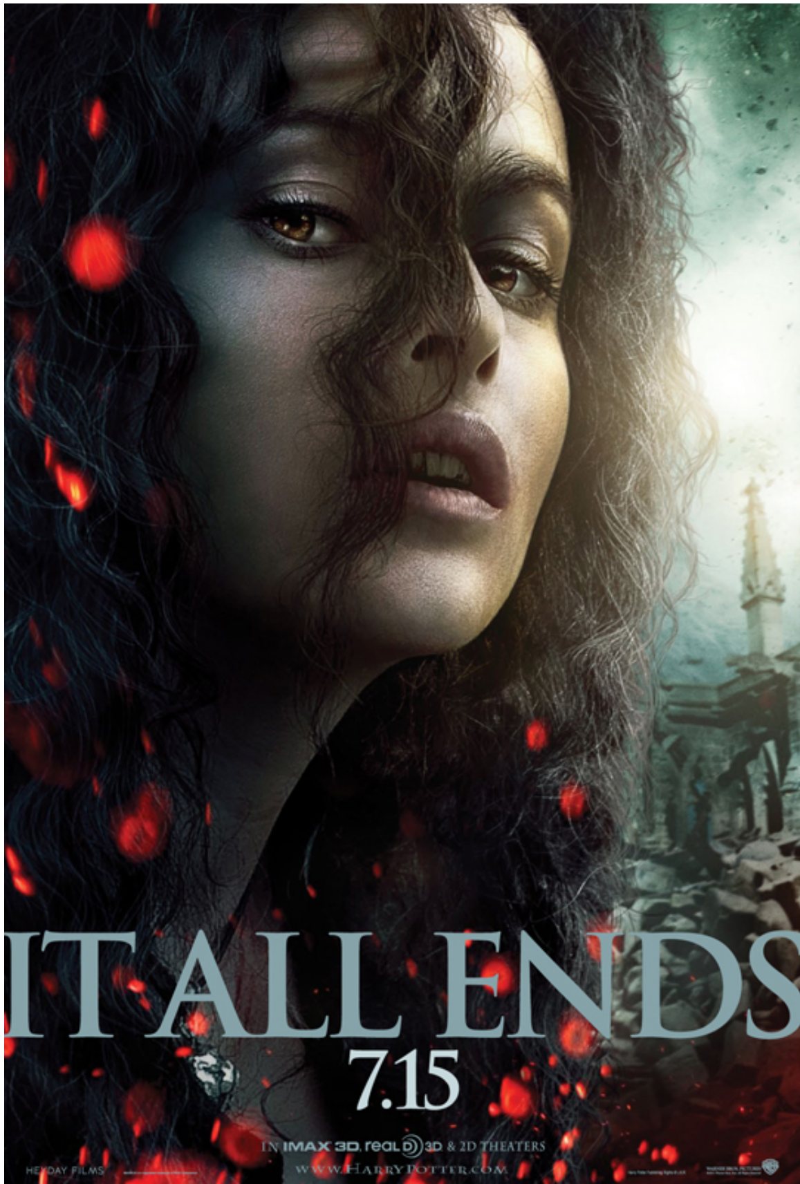
Crack De Harry Potter Y Las Reliquias De La Muerte Parte 2